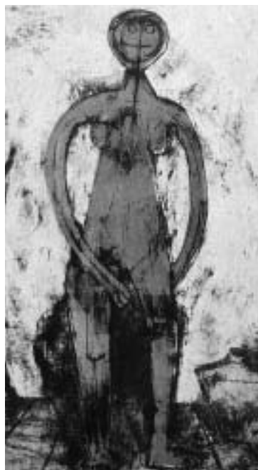
Rufino Tamayo, Desnudo en naranja , litografía a color, 1984.