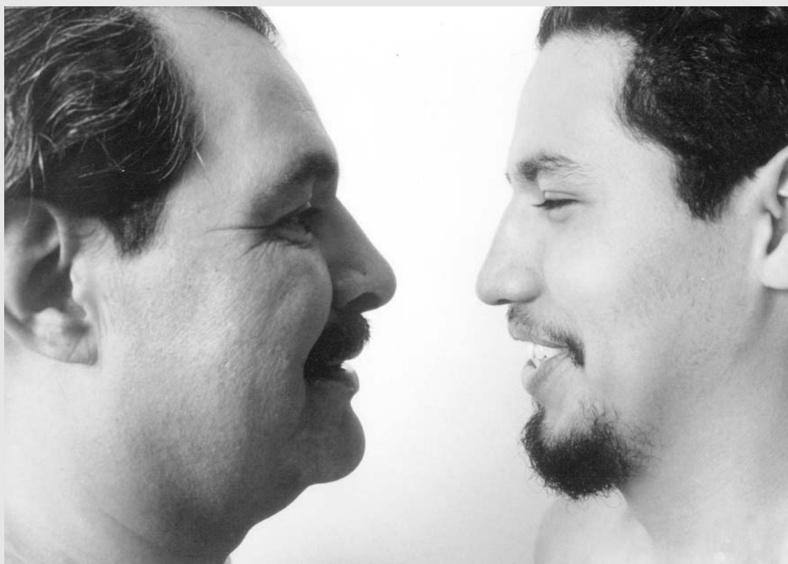
Paternidad afectiva. Calendario Coriac 2001

Marca mi vida el hecho de que mi padre me recibió al nacer. El doctor se fue a dormir, mi madre se agarró de la cabecera y mi padre me recibió. Este hecho afortunado ha equilibrado y fortalecido gratamente mi vínculo con mis padres.