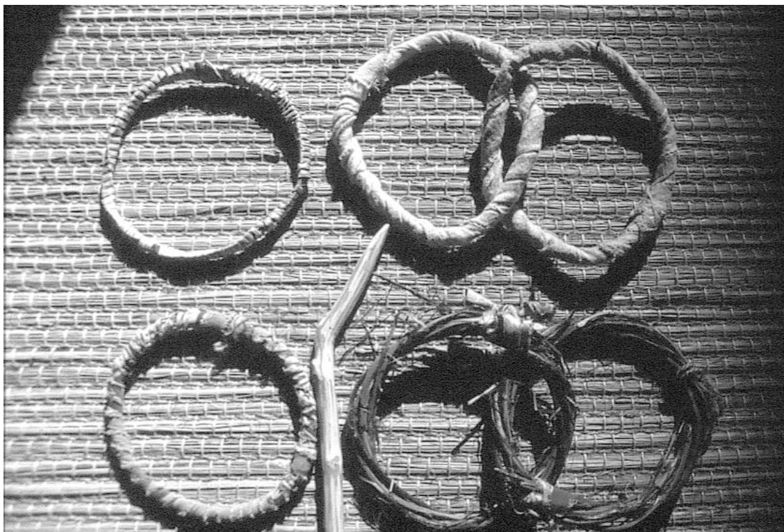
Ariwet ( rowera ).