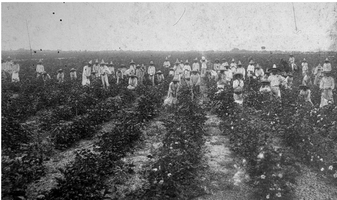
Pizca de algodón