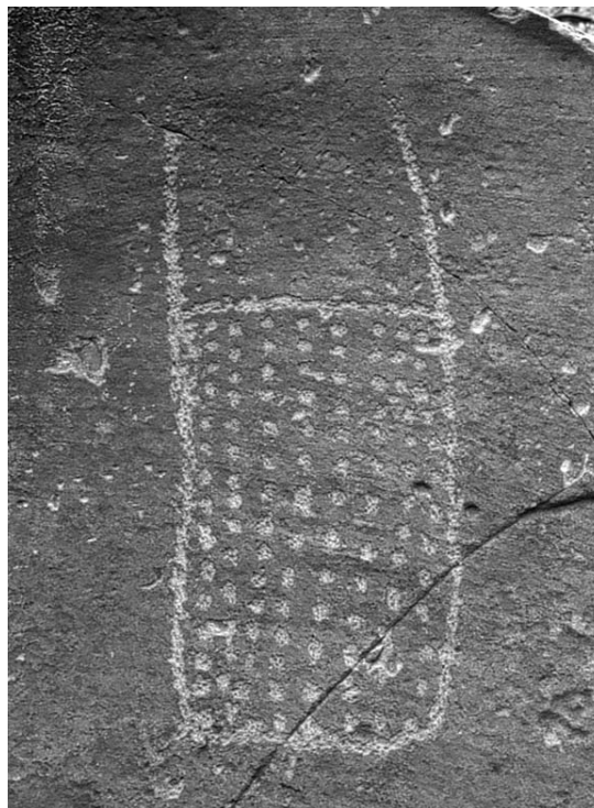
Petrograbado “El Barril”, municipio de Ramos Arizpe, Coahuila / Foto de Jan Kuijt