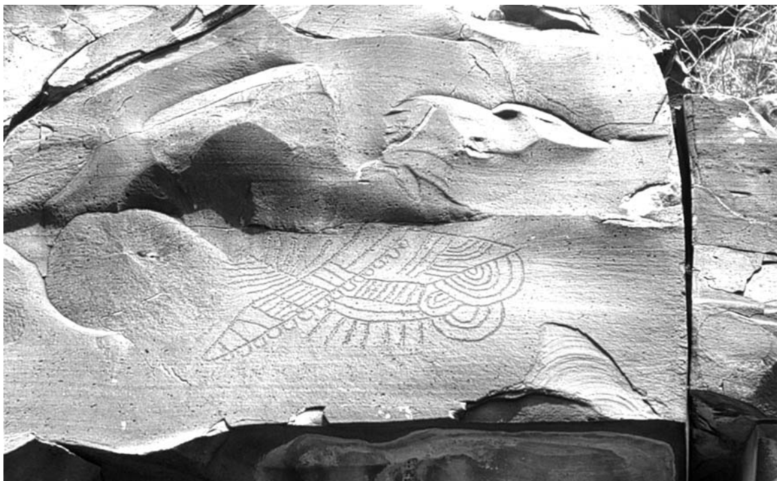
Petrograbados "El Barril", municipio de Ramos Arizpe, Coahuila

culturales se intersectaban con roles de género e incipientes distinciones de clase que tenían significación para las culturas material y religiosa de la vida misional.