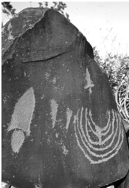
Petrograbados “El Pelillal”, municipio de Ramos Arizpe, Coahuila

de los caciques en cumplir los objetivos de los misioneros mediante el gobierno indirecto es especialmente visible en su poder de convocar para la misa, la instrucción religiosa y los trabajos diarios en la misión. En la medida que los caciques personificaran a la unidad étnico-política de sus distintas bandas, su elevada posición en las misiones definía la estructura del cabildo indígena colonial. Los grandes y jerárquicos cabildos indígenas fueron una característica central de la fase madura de las diez reducciones de Chiquitos, aunque los jesuitas nunca dejaron de utilizar la estrategia de las “entradas” al bosque para poblar y mantener esas misiones. Las estructuras formales de los cabildos indígenas no se instituyeron de una sola vez, sino que se desarrollaron gradualmente cuando las misiones alcanzaban una población estable de diferentes bandas residentes en ellas. Los misioneros contaban con los cabildos para hacer cumplir la disciplina