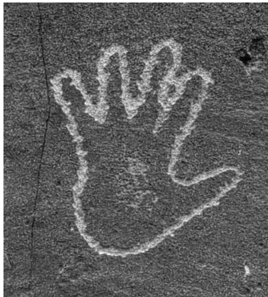
Petrograbados “El Barril”, municipio de Ramos Arizpe, Coahuila

y el liderazgo político, y sólo parcialmente adaptaron las nociones ibéricas de propiedad y riqueza. Los hombres ganaban méritos principalmente a través de la caza y la guerra, tomando cautivos y negociando conflictos. Las mujeres obtenían prestigio mediante sus habilidades como tejedoras, curanderas, productoras y procesadoras de alimento, y sus roles (aunque fueran secundarios) en las ceremonias religiosas. Estas aseveraciones no plantean una división sencilla y limpia entre “lo moderno” y “lo tradicional”, sino que subrayan las prácticas políticas híbridas de los indígenas coloniales en un contexto de poderes desiguales. Los pueblos sonorenses y chiquitanos atravesaron múltiples fronteras, ocupando distintos espacios ecológicos del bosque, el desierto y los pueblos de misión. Su misma lucha por sobrevivir puso en movimiento nuevos procesos culturales y sentó las bases de las historias de modernidad vistas desde la periferia.