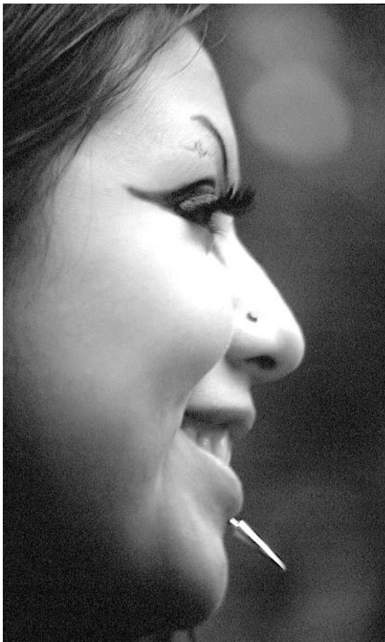
Dark, Coyoacán, ciudad de México, 2001 / Ricardo Ramírez Arriola