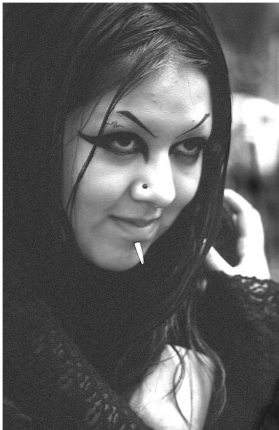
Dark, Coyoacán, ciudad de México, 2001 / Ricardo Ramírez Arriola