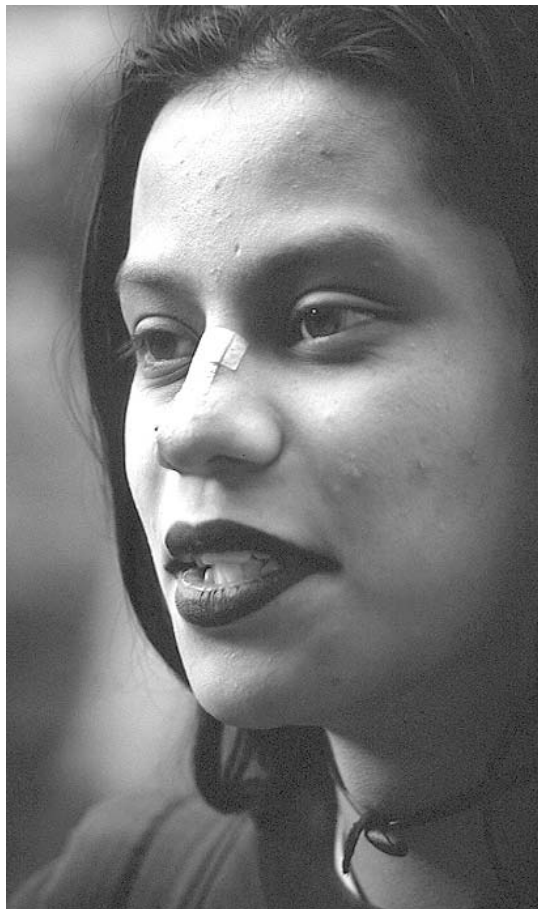
Dark, Coyoacán, ciudad de México, 2001 / Ricardo Ramírez Arriola

Diferentes instituciones sociales se han vinculado a estos grupos. Algunas de corte asistencialista ofrecen apoyos económicos y sociales (búsqueda de empleos y capacitación, resolución de conflictos legales, organización de espectáculos de recreación y deportivos, etcétera). La policía es una institución muy peculiar para estos jóvenes; aun con los diferentes programas de corte asistencialista realizados, hacen de ellos sujetos de represión policial y de extorsión económica. Los organismos sindicales, inexplicablemente, ignoran a esta importante “parcela” de la fuerza de trabajo la cual se dilapida sin lograr insertarla en actividades productivas. En general, puede decirse que las instituciones que ejercen el gobierno de la ciudad o bien no han dado la suficiente importancia al problema real, o toman tibias decisiones a fin de continuar administrando sin mayores conflictos su territorio.