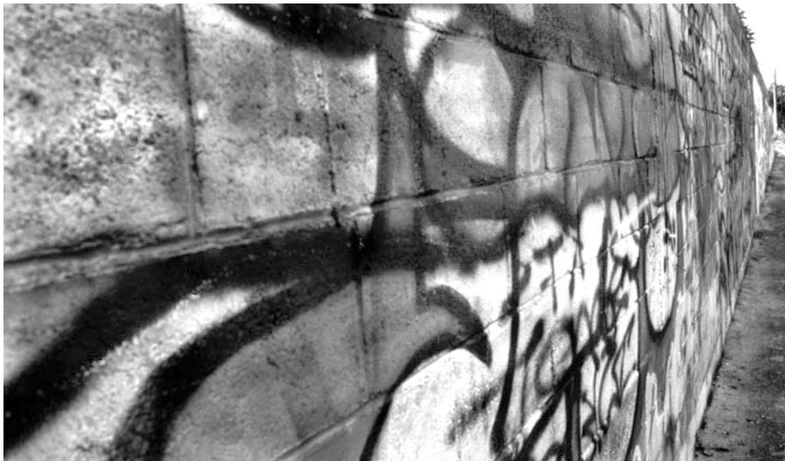
Ciudad de México, 2001 / Ricardo Ramírez Arriola