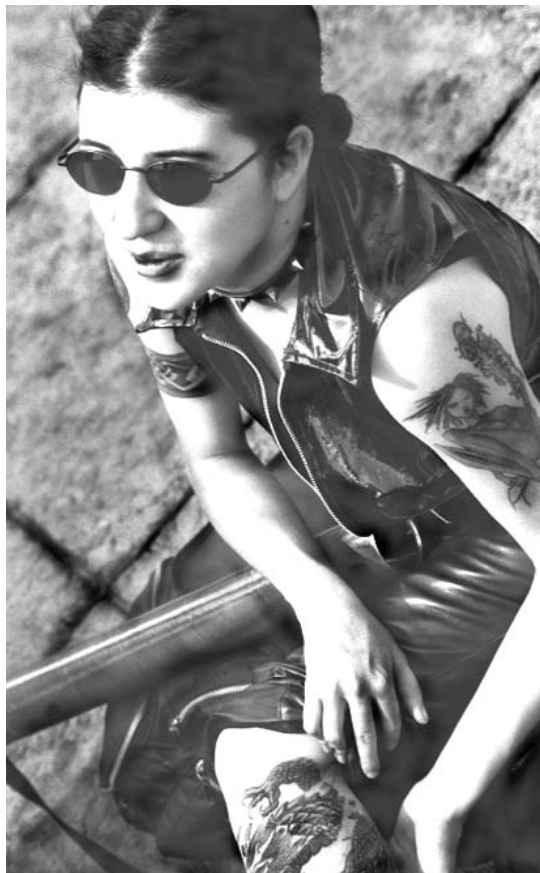
Zócalo de la ciudad de México, 2001 / Ricardo Ramírez Arriola

Hip Hoperos-cholos: Desde 1993 existen registros de raperos en el Estado de México, concretamente en Neza (Municipio de Ciudad Nezahualcóyotl). En el 95 ya hay un flujo de chavos, de ida y vuelta a ciudades fronterizas, roqueros que iban a Tijuana, por ejemplo, y se volvían cholos. Y así también cholos fronterizos que llegaban al DF y permanecían siendo cholos tratando de pregonar-difundir-convencer a otros de sus ideas. Gustan de música del género, desde Cypress Hill, A Tribe Called Quest, Wu Tang Clan, Public Enemy, D.M.C., hasta Dr. Dre, Kid Frost, Notorius BIG, Snoop Doggie Dog, 2 Pac, Capone, Ice Cube, y de ahí a los españoles como Mala Rodríguez, Hechos contra el Decorado, 7 Notas 7 Colores. Gustan de bailar breakdance , o sea “brequiar”, autodenominándose “B-Boys”. Son afectos a realizar pintas de graffiti pero sobre todo de murales. Su vestimenta común es pantalones de mezclilla, holgados, overoles, guayaberas, paliacates, camisetas de tirantes, tenis, jerseys y sudaderas deportivas, gorras beisboleras, anteojos, muy emparentados con la onda de los cholos, con cabello muy corto, peinado hacia atrás o bien, rapados; siendo aficionados a la modificación de modelos en sus autos y bicicletas.