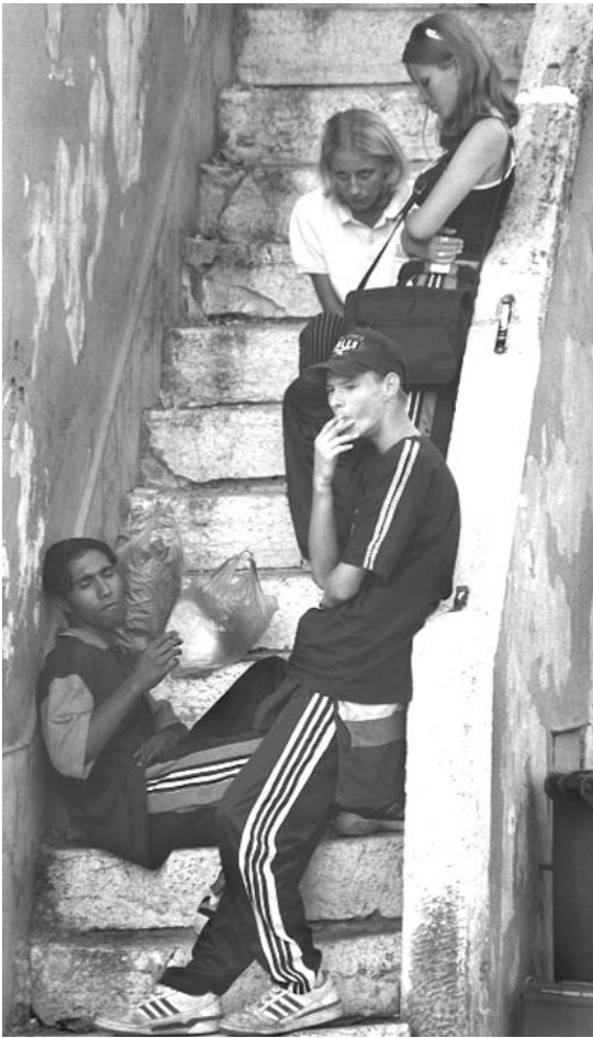
Jóvenes de la posguerra, Rovinj-Rovigno, Croacia, 1998 / Ricardo Ramírez Arriola

Pese a esto, la imagen de los jóvenes frente a la sociedad —o sea, su percepción social identitaria— sigue apareciendo, en una buena parte de la población, como “negativa”, confusa, incierta o, en el mejor de los casos, de “duda” ante su futuro desarrollo generacional.