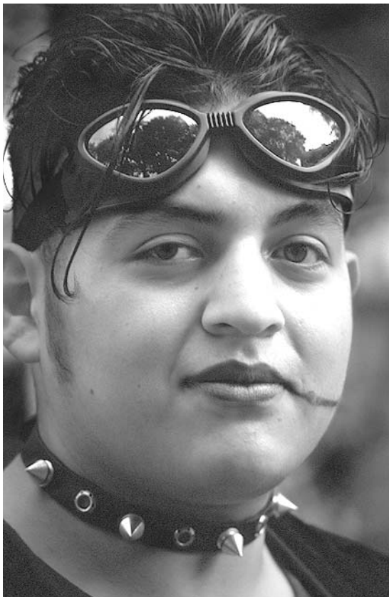
Dark, Coyoacán, ciudad de México, 2001

genera al exigir un cambio de rumbo económico y de estructuras políticas y administrativas que permitan el surgimiento de un sistema político democrático después de 70 años de existencia de autoritarismo gubernamental sustentado en un “partido oficial”.