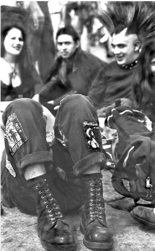
Zócalo de la ciudad de México, 2001

El concepto juventud tiene un carácter polisémico partiendo de la idea de que éste se construye histórica y socialmente, es decir, la idea de “ser joven” varía en tiempo y espacio dependiendo de las características que asume cada sociedad.