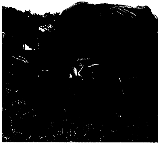
Cuenca del Papaloapan, Veracruz; Agustín Estrada