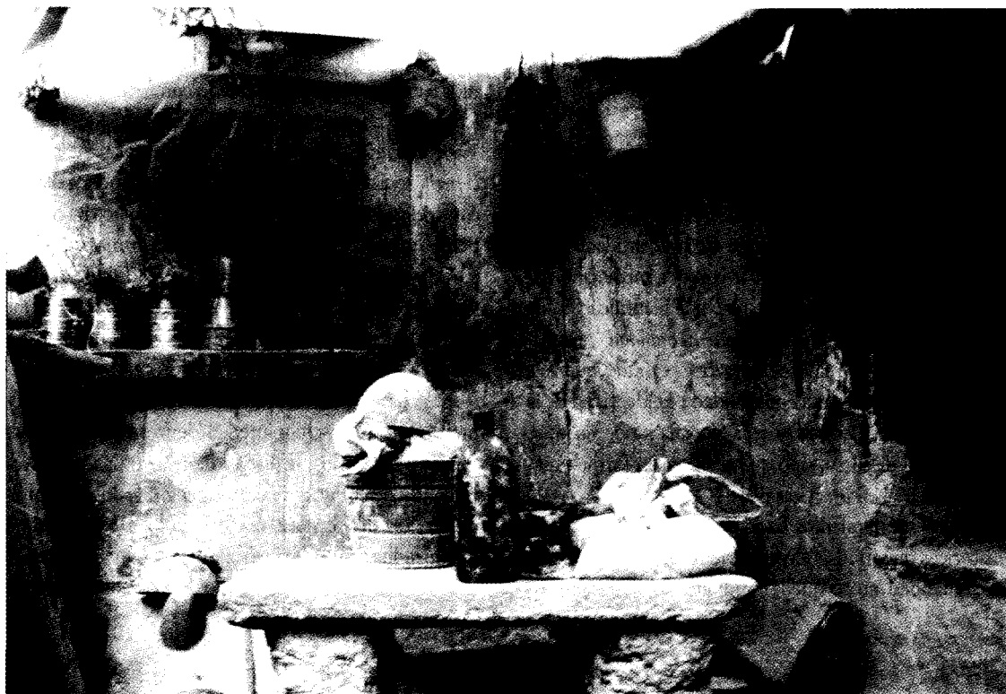
Ocosocuaula, Chiapas; Agustín Estrada