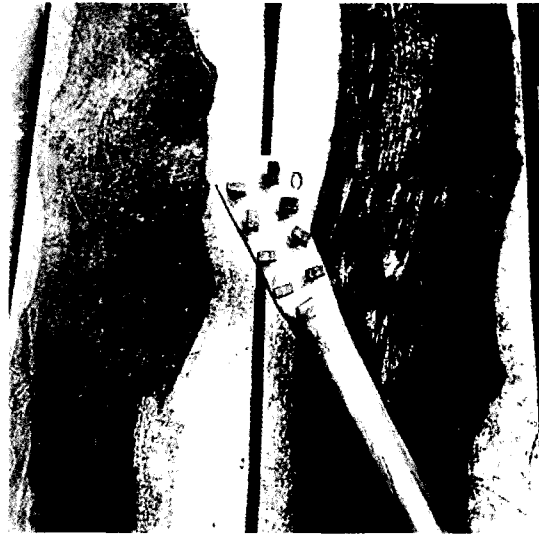
Veracruz; Agustín Estrada

Pronto, el uso y la práctica dominante de la ciencia relegaron las cuestiones más visibles de las implicaciones religiosas y sociales en las acciones de estos hombres, e impusieron sus propias visiones, cuya fuerza y aparente universalidad ocultaba muchas veces su origen.