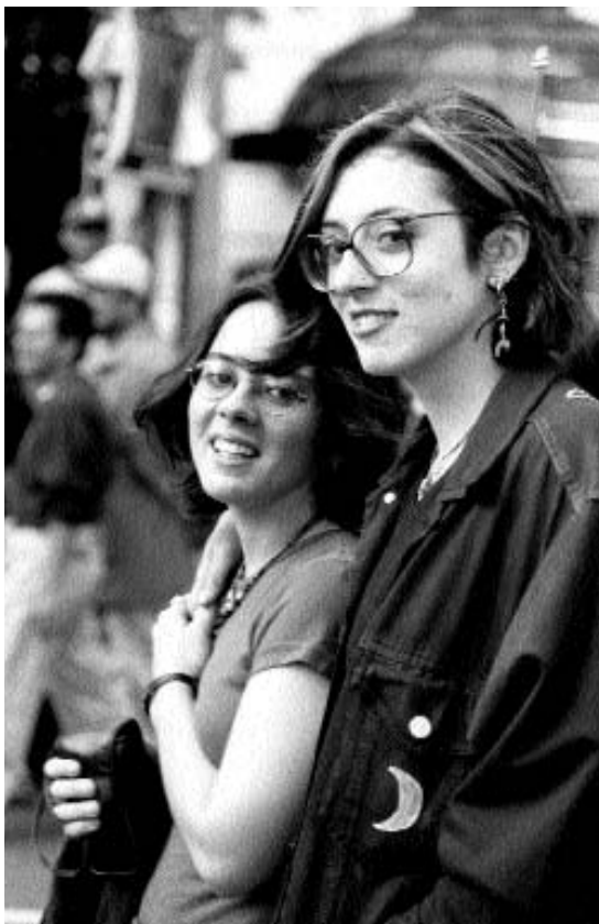
Sin título, Ricardo Ramírez Arriola

Dentro de la sociedad local, el papel de las mujeres ha sido culturalmente establecido dentro del matrimonio y el hogar, para garantizar esto se les educa como guardianas de la moral y la honra familiar. La valoración social de lo femenino se basa en el binomio conyugalidad-maternidad (70 por ciento considera que lo más importante