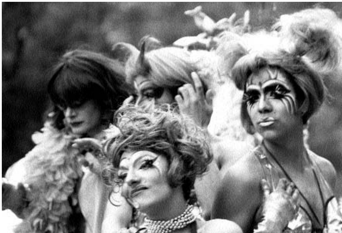
Sin título , Ricardo Ramírez Arriola

vida de los seres humanos, es “una forma de acción” para democratizar toda la vida personal, social e institucional. El punto nodal de las transformaciones se encuentra en la sexualidad y ésta sólo se puede desarrollar plenamente en “relacionamientos puros”, caracterizados por la “reestructuración genérica” de la intimidad sexual femenina, el amor basado en la diferencia y en el conocimiento del otro, y el florecimiento del erotismo. El reencuentro de los sexos, el proyecto reflexivo del yo y “la sexualidad plástica” implican para el autor la promesa de la democracia, de ahí que su propuesta sea la pluralidad: ningún límite debe ser impuesto a la sexualidad, sólo aquéllos basados en el principio de autonomía y negociados al interior de la pareja, la cual no necesariamente tiene que ser monogámica ni heterosexual.