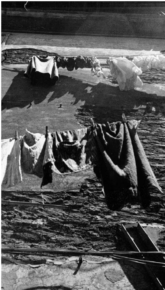
Trapitos al sol (detalle), Jorge Acevedo

La pregunta que originó el presente artículo fue una de índole metodológica: ¿cómo caracterizar a escala nacional, en términos demográficos, étnicos y culturales, a un electorado del pasado y, a la vez, identificar los principales cambios que experimentó a largo plazo? La complejidad de esta cuestión se aprecia mejor cuando se considera que interrogantes como la anterior en el caso de las y los votantes de finales del siglo XX son posibles de responder por la existencia de un amplio conjunto de datos estadísticos oficiales y no oficiales, de diferenciada cobertura geográfica; 1 pero la escasez o ausencia de tales materiales para otras épocas, en especial antes de 1950, es un primer obstáculo a vencer para tratar de aproximarse a quienes, otrora, eran periódicamente convocados a asistir a las urnas. 2