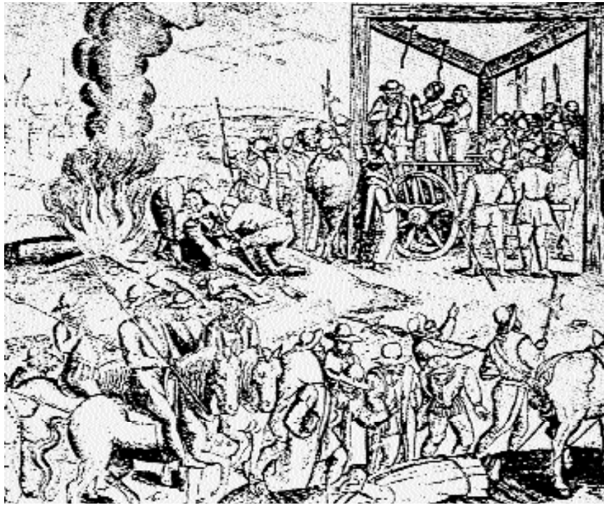
Suplicio de protestantes en Inglaterra bajo el reinado de Mary Tudor, grabado anónimo inglés, siglo XVII. Col. particular, Lewes, Sussex, Inglaterra.

Por esa razón señalará Hans Kohn que en la recuperación del esquema religioso, realizado por el pensamiento nacionalista, encontramos la misma perspectiva intolerante que vemos en la edificación de la herejía en las inquisiciones. Traidor a la patria es la fórmula heredada, útil para reprimir la diferencia política cuando el llamado a la ineludible lealtad patriótica está en juego; de la misma manera el señalamiento y la edificación del enemigo “extranjero”.