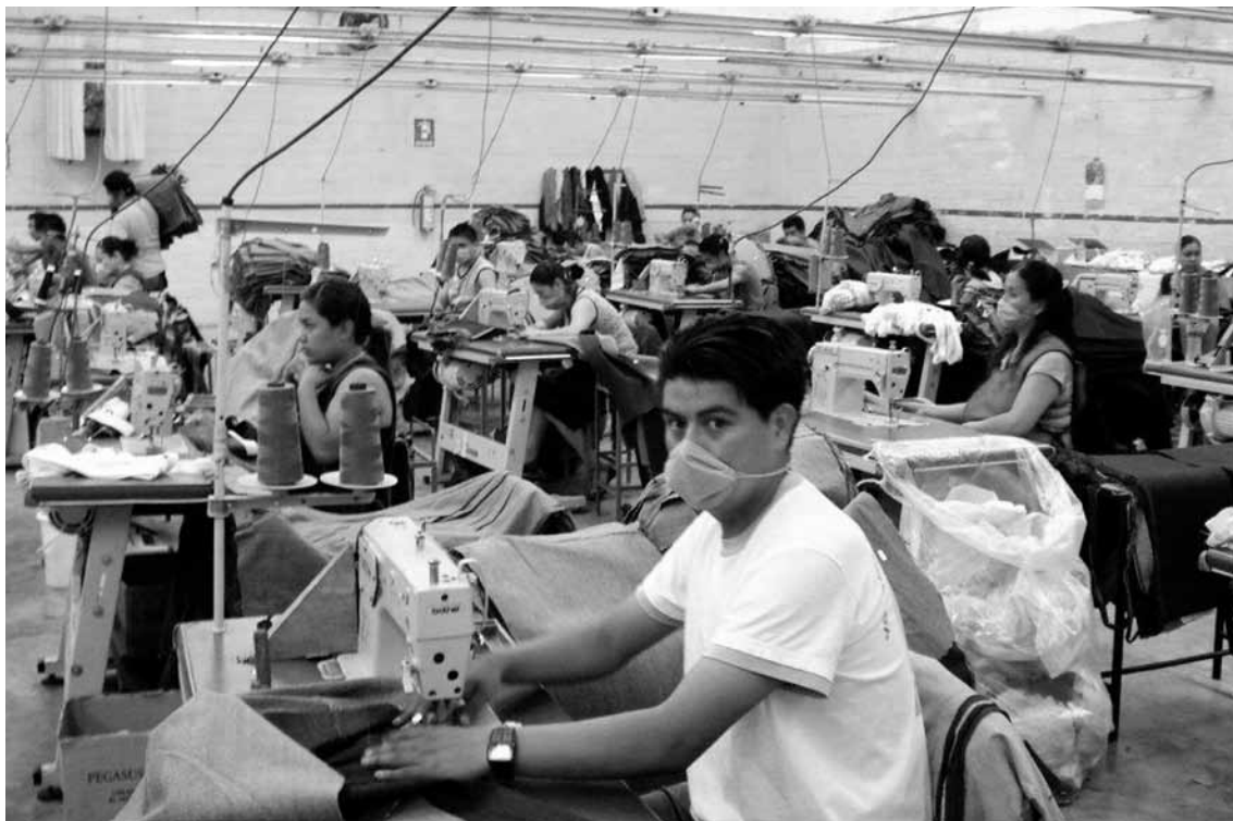
Opciones de trabajo reducidas y precarias en la maquila para hombres y mujeres, 2010.

mujer, tal y como lo estableció la Organización de las Naciones Unidas en 1994: