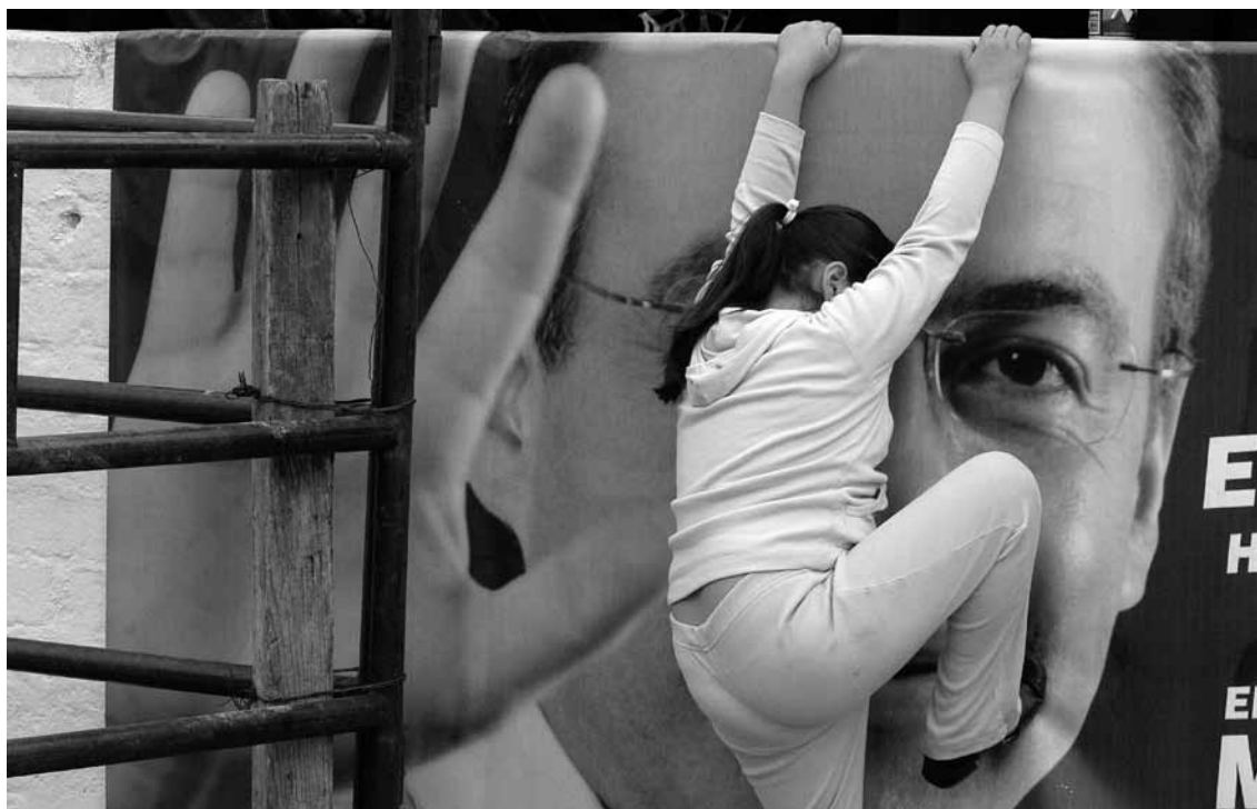
Michoacán, México. Una niña juega ante una manta de la campaña de Felipe Calderón Hinojosa, candidato del PAN a la presidencia, durante el evento de campaña, 11 de febrero de 2006.

su objetivo) a proyectos políticos de un patrón. Por otro lado, se estima que el mediador está consciente de su función en la red clientelar y por ello la rentabiliza, pero vale la pena cuestionar si la relación clientelar tiene efecto aun cuando el mediador no tenga como objeto esta capitalización política de sus acciones. En este caso, es el patrón quien aprovecha la organización, actividad de gestión, espíritu filantrópico o labor educativa del mediador y se apropia de potenciales beneficios políticos que colateralmente aparecen de la interacción con él y, a través suyo, con la clientela. Por tanto, la relación clientelar subsiste.