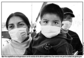
Una gran epidemia de gripe que se está propagando en el Valle de México. Los cubrebocas son una medida de primera para evitar la posible infección con el potencial agente, que llega a aparecer en algunas farmacias.