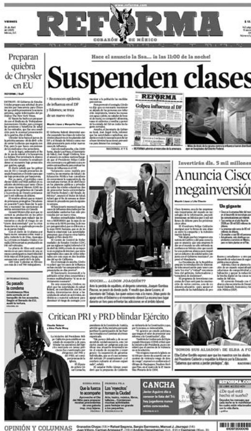
El Inicio de la emergencia, viernes 24 de abril

No obstante que trabajamos con un corpus acotado (81 primeras planas), la lectura y varias sucesivas relecturas del material nos plantearon muchas incógnitas, inquietudes, observaciones y conclusiones, que es imposible siquiera mencionar en esta primera exploración. Ante este mar de información nos planteamos una pregunta que guiará el análisis: ¿qué historia contó la prensa y cómo se vinculó con el contexto público de esos días? A fin de cuentas, las noticias son una historia, una historia que