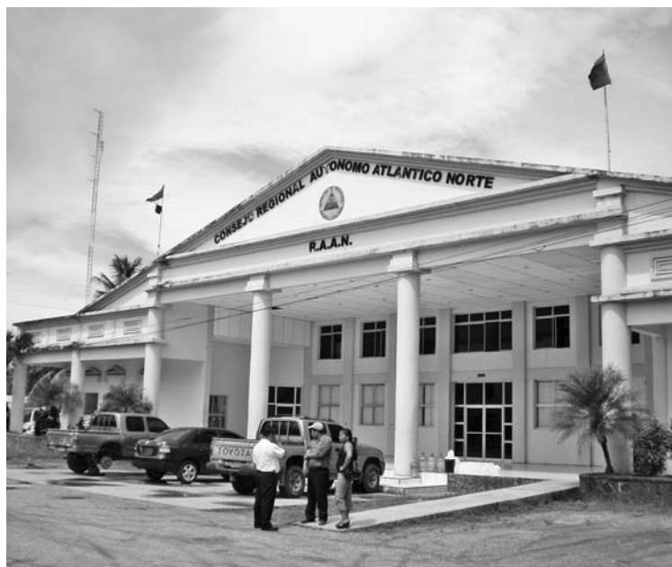
Consejo Regional Autónomo Atlántico Norte, Puerto Cabezas.

de la autonomía establecida y la naturaleza jurídica del estatuto de autonomía, y, por otro, el proceso de construcción de las entidades autónomas. Para ello, habría que analizar el tratamiento legislativo del régimen de autonomía en las diferentes redacciones que ha experimentado la actual Constitución nicaragüense: en la redacción de 1897 y en la de la reforma constitucional de 1995. En esta última, los diputados de las regiones autónomas en la Asamblea Nacional lograron introducir una nueva redacción que afianzó los derechos autonómicos de los costeños, especialmente en el texto del artículo 181.