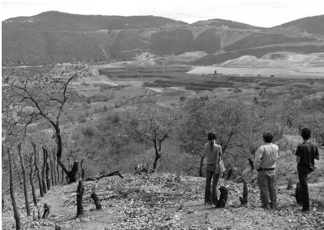
El nuevo paisaje minero en la microrregión de Mezcala.

comenzaron a cultivar en una porción del valle de 500 hectáreas, hoy ocupada por la alberca de lixiviación de Goldcorp 11 . Alrededor de la pequeña planicie agrícola se encuentran las tierras de uso común con una extensión de 830 hectáreas. Son tierras semidesérticas usadas para el pastoreo de ganados familiares y para inducir el crecimiento de agaves para el destilado de mezcal que vendían en las ciudades de Iguala y Chilpancingo. En la década de 1940 empezó el minado subterráneo de El Bermejil y Los Filos, cuyo material era fundido en el pueblo de Mezcala. Los campesinos de Carrizalillo permitieron la actividad minera a cambio de enrolarse como mineros y obtener un salario. De este modo, los ejidatarios organizaron su sus-