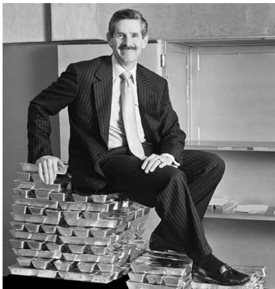
Rob McEwen, dueño de 75 % de las acciones de Goldcorp. McEwen ostenta su riqueza sentado en 100 000 onzas de oro con un valor de 83 millones de dólares estadounidenses a precio actual.

invocando los beneficios recibidos, y otra que la repudia invocando “argumentos de injusticia” y que llama a transformar la reciprocidad negativa en reciprocidad balanceada . Argumentamos que en este proceso político se distinguen tres posibles posturas: la primera es una ética fuerte que rechaza la ocupación y destrucción minera del territorio por considerarlo un bien patrimonial inalienable; la segunda, una ética negociada que acepta una relación contractual corporación-comunidad en la que la destrucción del paisaje puede ser compensada por dinero calculado bajo criterios de justicia distributiva; y la tercera, una ética débil que se rinde a la imposición de un régimen de alienación del territorio y a la dilución coactiva del sujeto colectivo en grupos clientelares a cambio de recibir certidumbre personal en la vida cotidiana , como la garantía de empleo y seguridad personal; la de recibir sanciones positivas como dádivas, repartos o ascensos laborales; la de evitar sanciones negativas, como castigos laborales, amenazas personales o demandas judiciales 3 .