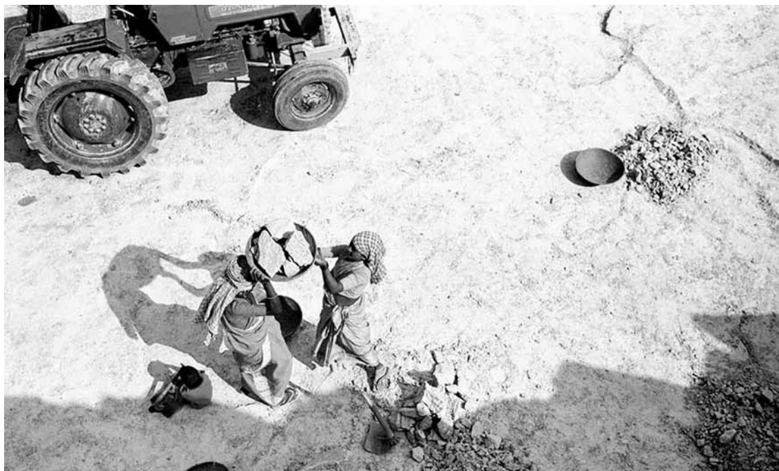
Cargando piedras y cuidando a los niños. Andhra Pradesh.

cómo experimentan este tipo de compromisos económicos, el significado social de la deuda es tan importante como su dimensión monetaria. El significado social remite a un conjunto de derechos y obligaciones que ligan a deudores y acreedores, así como a sus consecuencias en términos de pertenencia social, posición y dignidad. La diversidad de terminologías de la deuda es reveladora. Dos transacciones similares desde una perspectiva financiera, a propósito de suma, costo y duración, pueden ser calificadas de manera muy diferente una de otra. En los pueblos estudiados se emplean los términos siguientes: kadan posiblemente sea muy similar al término “crédito”; kadanganan , “estar endeudado”, suele percibirse como algo peyorativo, en tanto implica dependencia; el término kanthu vatti se refiere a las formas más peligrosas de préstamo, significa literalmente “chupar la sangre mediante intereses” y se asocia con tasas de interés muy elevadas y una presión fuerte para obtener el pago; kodothu vangaradu es la expresión más utilizada y puede traducirse como “dar y recibir”; el