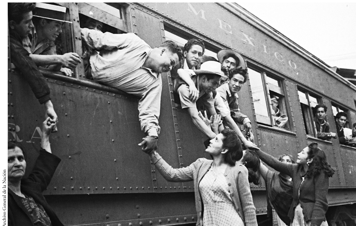
Archivo General de la Nación

Estación de ferrocarril Buenavista, México, D.F., c. 1945. Sección concentrada, "Braceros", AGN.