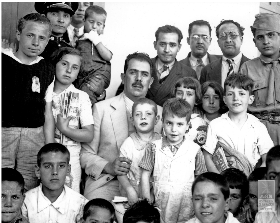
Los niños refugiados españoles y el presidente Lázaro Cárdenas, 1937.

La puesta en práctica de políticas tendientes a la atención de estos problemas hizo más compleja la organización y el funcionamiento del Departamento Migratorio, y en materia inmigratoria obligó a establecer nuevas especificaciones en los procesos de documentación de los extranjeros. Por primera vez se estableció una diferencia entre inmigrantes e inmigrados. Los primeros fueron todos aquellos que ingresaban al país con el propósito de radicar y con la autorización de ejercer actividades remuneradas o lucrativas. La segunda categoría estaba formada por aquellos extranjeros que, después de cinco años de residencia consecutiva, adquirirían el derecho de estancia definitiva. Se reconocía, además, la condición de turista, transmigrante y visitante, que en las leyes subsecuentes