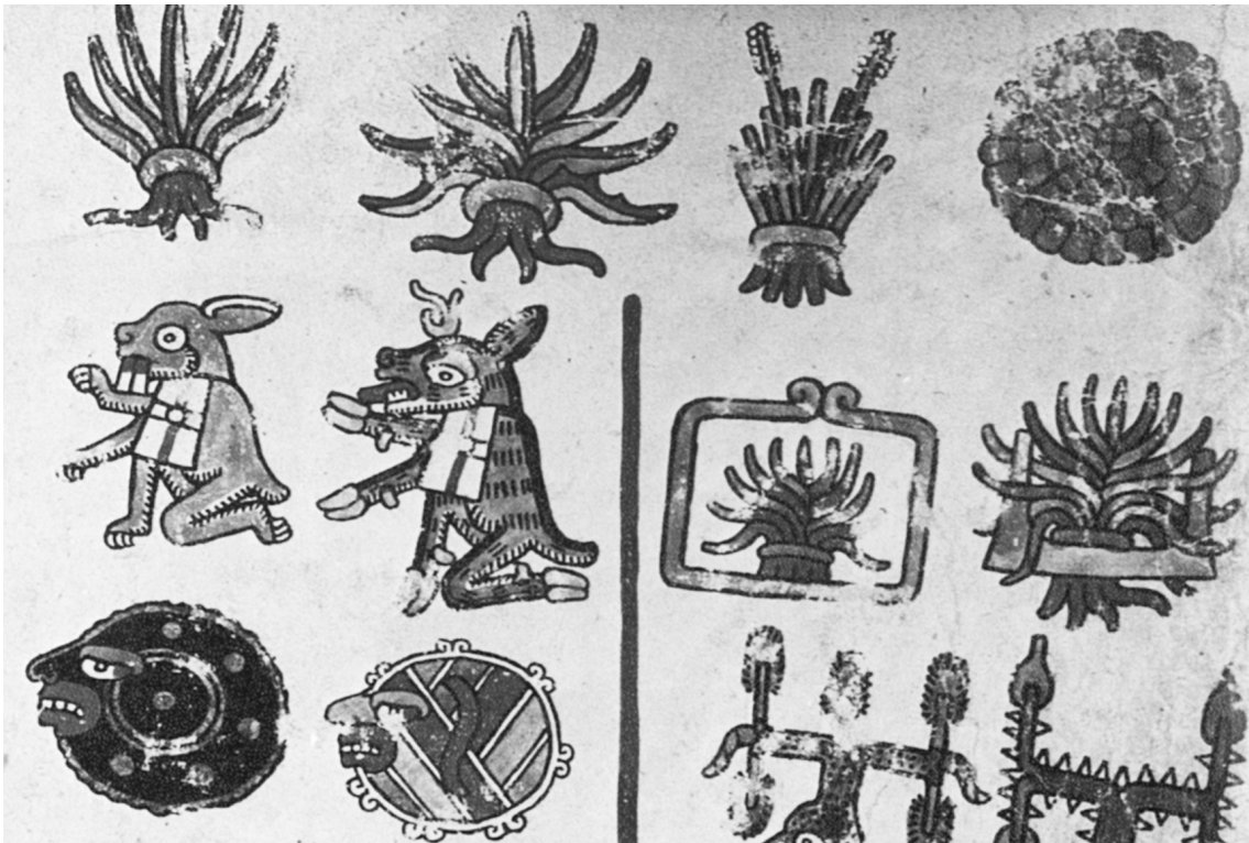
Códice Viena, 34.

los días, posiblemente debido a la forma en que se registró alfabéticamente el mixteco hablado, o como resultado de la variabilidad dialectal. Su cuidadoso examen de dichas variaciones fortalece los argumentos concernientes a la forma hablada de los nombres de los días en mixteco.