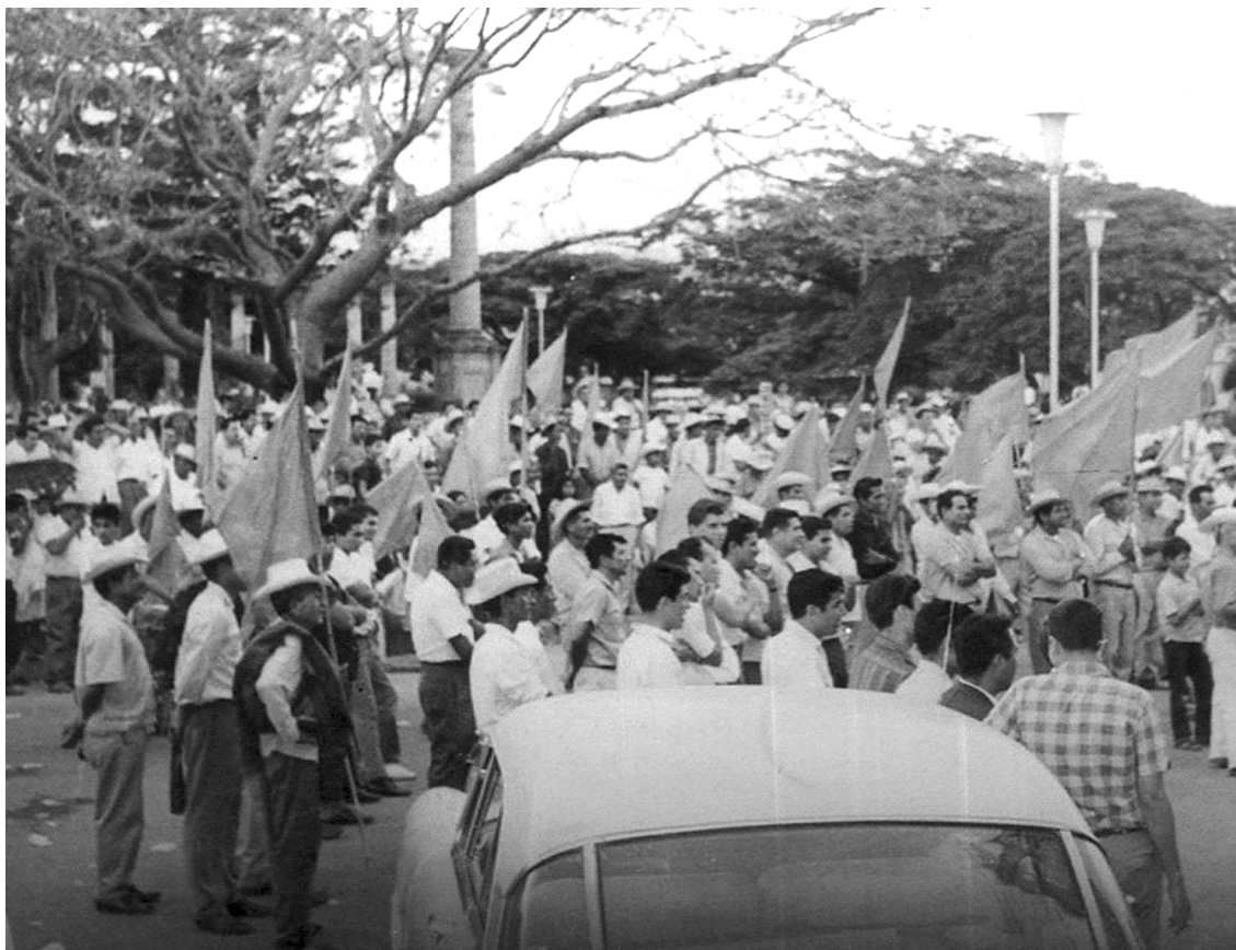
Mitin del PPS en la plaza principal de Tepic.

cación de los códigos de lo moral y lo político; de hecho, puede incluso decirse que hay una supeditación de la racionalidad política a las consideraciones de orden moral. Es así que los momentos de toma de decisiones más importantes ante los que se encontró el equipo gasconista fueron resueltos no por un cálculo que ofreciera ventajas o avances estratégicos o tácticos ante un adversario público, sino por una dura defensa de los valores morales característicos de su constitución identitaria. Como ejemplo paradigmático de lo dicho está la declaración de Alejandro Gascón ante la propuesta hecha por el vocero gubernamental, Porfirio Muñoz Ledo 15 , para dar salida al