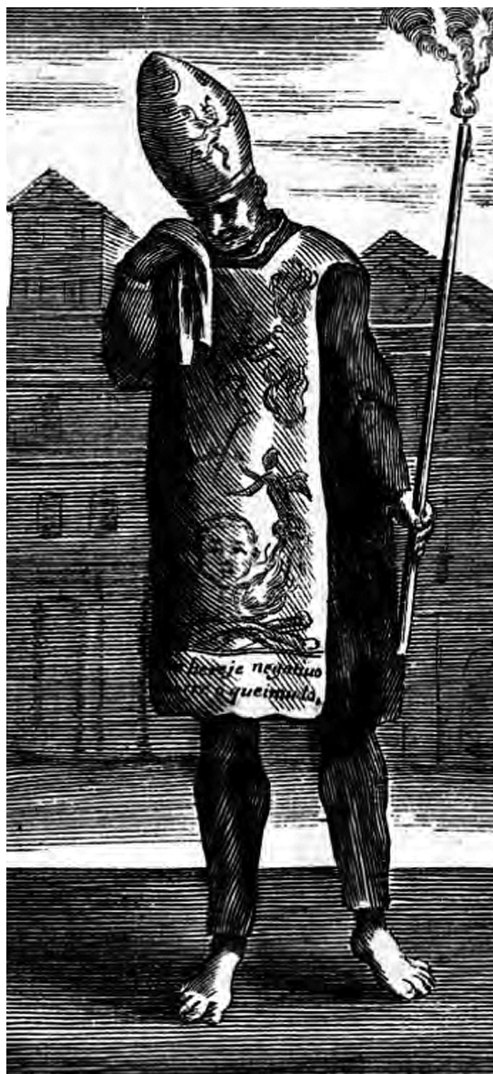
El auto de fe de Paragloss en Voltaire, Candide ou l'Optimisme , Sirène, París, 1759.

esas dichas provincias, de manera que no entre alguno de los prohibidos; ordenando á los dichos comisarios os avisen muy ordinario de la diligencia que cerca de esto hicieron, porque por ser este negocio de la calidad y substancia que es, será muy necesario que en el cumplimiento y ejecución haya toda advertencia, de manera que por este camino no pueda entrar mala doctrina en esos reinos, procediendo con rigor y escarmiento contra los que cerca de ello se hallaren culpados" ("Instrucciones...", 1906: 243).