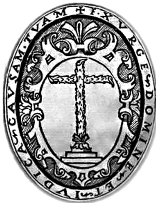
Escudo del Santo Oficio.

La disputa más enconada acerca de la “limpieza de sangre” se vivió en el siglo XVII. La ascendencia de las familias conversas aún se conservaba en la memoria debido a la cercanía de su expulsión durante el siglo anterior. La conversión al cristianismo de muchos judíos tendió a la formación de una descendencia que, según los cánones, estaría exenta de muchos privilegios. Estas familias de origen converso, en la defensa de su posición, jerarquía y estatus, intentaron congraciarse por medio de sus riquezas (falsificando sus identificaciones y sus lazos consanguíneos) o del entronque matrimonial con familias de viejos cristianos (Martínez Bara, 1980: 304). A pesar de las estrictas reglas establecidas para su formación, algunos conversos, penitenciados, parientes de relajados, moriscos, etc., falsificaron una genealogía e inventaron una ascendencia cristiana vieja. La Inquisición fue una de las primeras instituciones en aprobar la necesidad de definir la competencia de su personal mediante esta práctica. Al mismo tiempo, fue el único organismo español autorizado para formar y certificar la genealogía y la limpieza