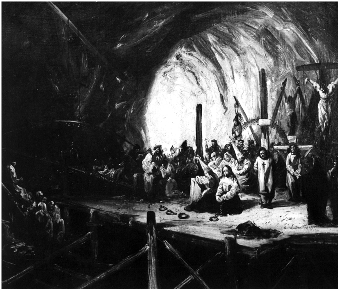
Lucas (1824-1870), Escenas de la Inquisición , Louvre, París.