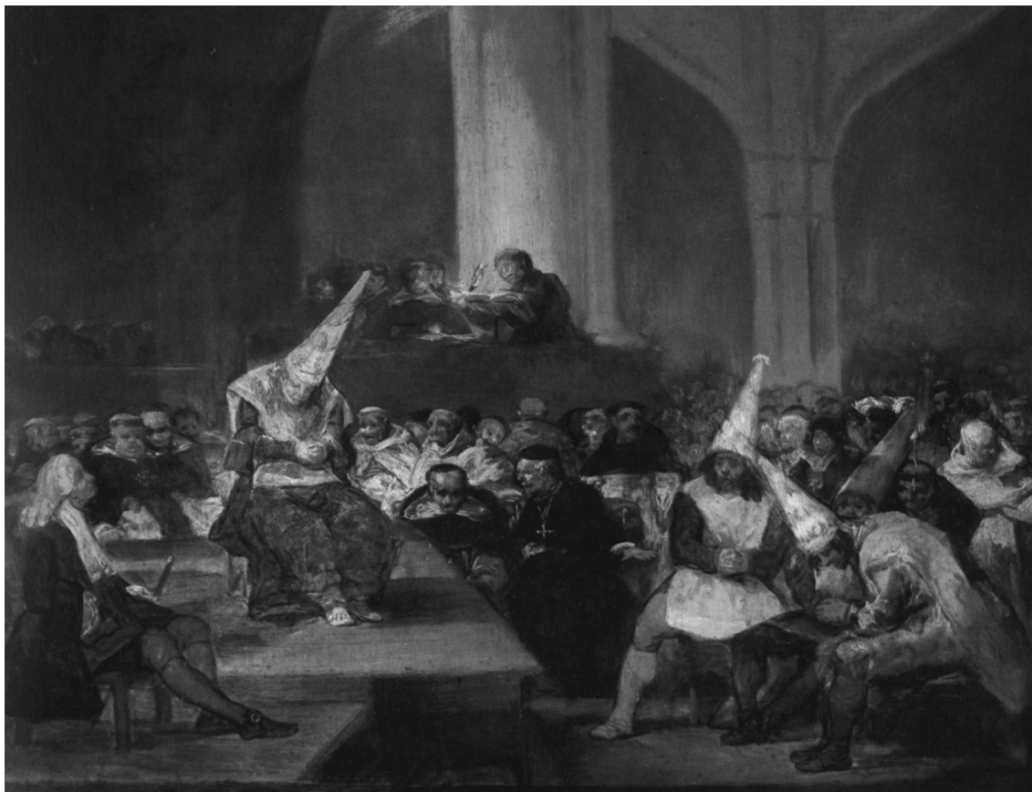
Goya, Escenas de la Inquisición , Real Academia San Fernando, Madrid, ca. 1794.